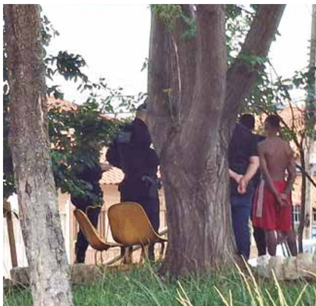
Revista feita por policiais militares na praça da QE 34 na semana passada: ações constantes

Além da queda registrada no índice de furto em veículos, a atuação estratégica da unidade, em conjunto com a parceria da comunidade, obteve resultados relevantes: as tentativas de homicídio tiveram redução de 50%, roubo de veículos 20%, roubo a transeunte 30%, roubo em comércio 77%, resultando em uma queda de 33% nos crimes contra o patrimônio, no