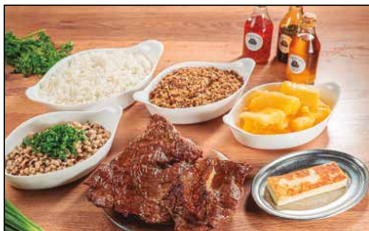
A carne de sol, que mantém o mesmo padrão desde que a Casa foi inaugurada, há mais de 4 décadas