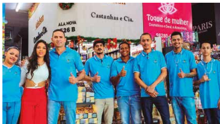
Equipe está pronta para atender bem aos clientes