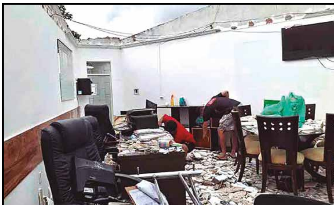
Com o vendaval e chuva, toda a sede da Asffecab, na Feira do SIA foi destruída, além disso, prejuízos se estenderam para outras bancas e quiosques externos à feira

"Eu vi os vídeos, o estrago foi grande, já acionamos o nosso pessoal e vamos buscar ajudar, disse Yanez.